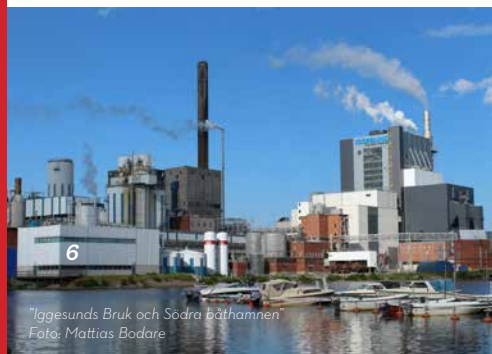
"Iggesunds Bruk och Södra båthamnen"

Antalet av- och påstigningar på X-tåget från stationen i Iggesund är 19000 per år, vilket motsvarar dryga 50 resenärer per dag. Stationen är viktig för att få unga som studerar att stanna kvar på orten, då de kan välja att pendla till studieorterna istället för att flytta dit.