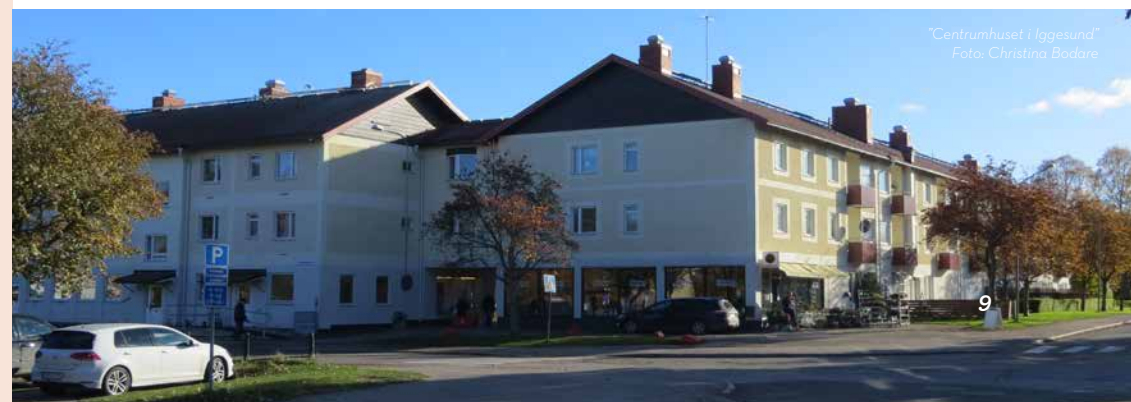
"Centrumhuset i Iggesund"

Om varje hushåll spenderar 10 kr mer per dag på varor och tjänster på orten så ökar den lokala omsättningen med 7,5 miljoner kr på ett år!