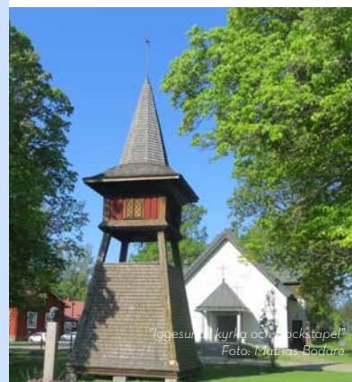
"Iggesunds kyrka och klockstapel"

Århundradena som följde präglades av rysshärjning, kolning, smedjor och utökad sågverksindustri. I början på 1900-talet lades grunden för dagens pappersindustri då en sulfat- och sulfatfabrik byggdes vid Iggesundsåns utlopp i fjärden. Idag är Iggesund Bruk kommunens största arbetsgivare och satsar på hållbart skogsbruk med förnybar råvara.