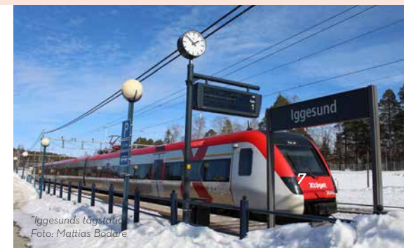
"Iggesunds tågstation"