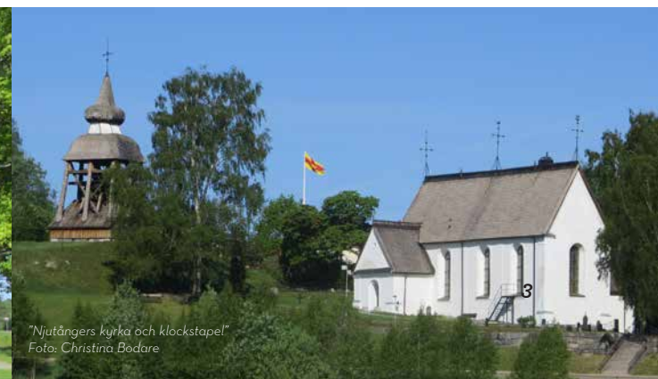
"Njutångers kyrka och klockstapel"