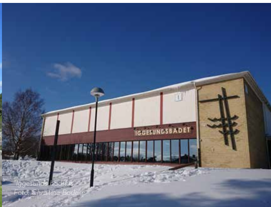
"Iggesunds badhus"