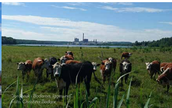
"Jordbruk i Bodarna, Iggesund"