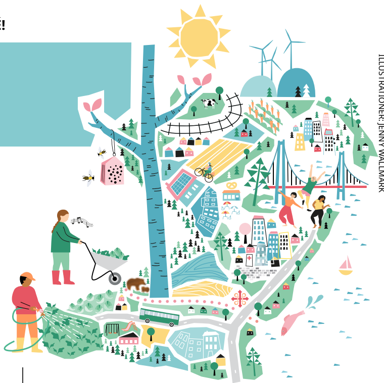
ILLUSTRATIONER: JENNY WALLMARK

sationer, kommuner och landsting som kan ansöka om statsbidrag.